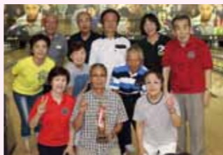
優勝者を囲んで全員の集合写真